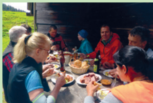
Eine gute Brotzeit gibt es für die Helferinnen und Helfer bei der alljährlich stattfindenden Holzaktion und dem Hüttenputz