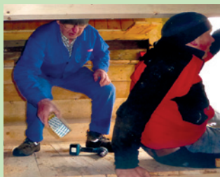
Aus Brandschutz-Gründen wurde ein zusätzlicher Fluchtweg aus dem Schlafraum geschaffen